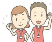
市民体育祭最終日は陸上競技