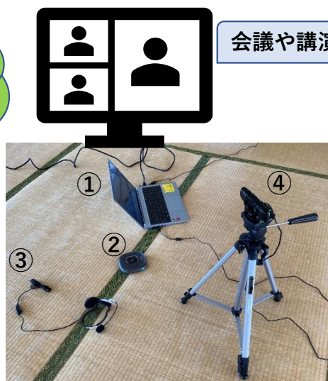
ウェブ会議に必要な機器(協議会で購入済)