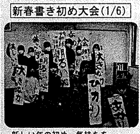
新春書き初め大会(1/6)

今年は、小学生が参加してくれました。先生に教えて頂きながら、ステキなアレンジが出来ました。