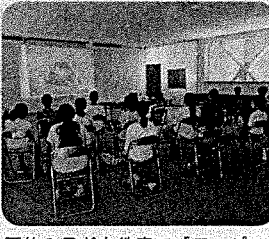
夏休み子ども教室で「ワンピースフィルムレッド」を鑑賞しました。