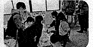
子ども達に大好評!