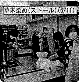
草木染め(ストール)(6/11)