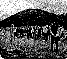
たくさんのチームに参加して頂き、楽しくプレーされました。