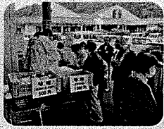
おもち、とうふ、こんにゃく等も大人気!