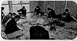
昔ながらのしめ縄作り(12/17)