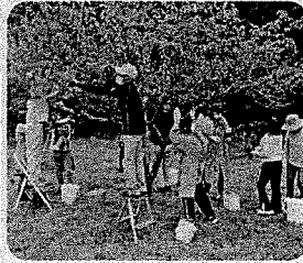
今年も、大収穫の梅狩りとなりました。