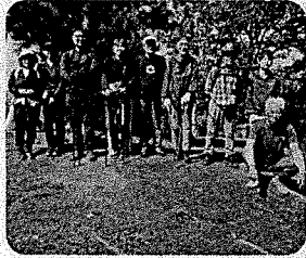
今年も、良い天気にもまれて暑い中登山を楽しみました。