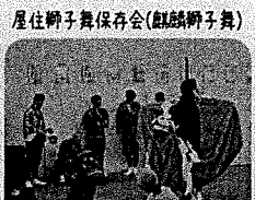
屋住獅子舞保存会(戯談獅子舞)