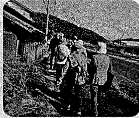
家奥、金屋の集会所に立ち寄り集落代表の方にお話を頂きました。地元再発見の健康ウォークでした。