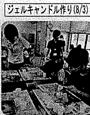
ジェルキャンドル作り(8/3)