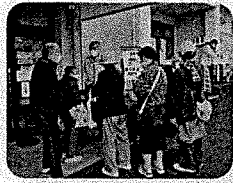
今年、柿の葉寿司・焼きそばを販売、大盛況でした。