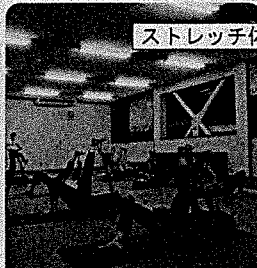
ストレッチ体操(7/7・8/4)