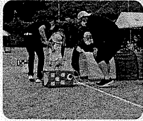
4年ぶりに開催された大運動会、大勢の地区民に参加して頂き、盛り上がりしました。