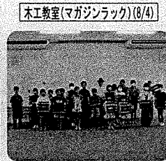
木工教室(マガジラック)(8/4)