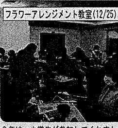
フラワーアレンジメント教室(12/25)

今年は、小学生が参加してくれました。先生に教えて頂きながら、ステキなアレンジが出来ました。