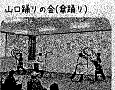
山口踊りの会(倉踊り)