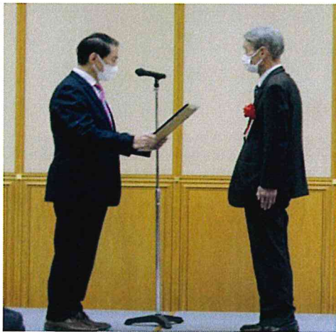
令和7年2月3日 表彰式

令和6年度 地域社会の活性化に貢献してきた活動団体として「いきいき社まちづくり協議会」が「頑張る住民自治活動 知事表彰」を受けました。共助交通「いきいき社バス」の運行により通院、買い物、小学生の通学などに利用いただいているほか、地区の防災マップ「避難スイッチ」を作成し避難者支援に取り組んでいる事が評価されました。