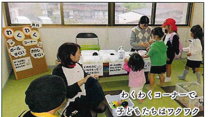
わくわくコーナーで 子どもたちはワクワク