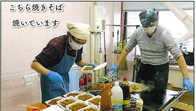
こちら焼きそば 焼いています