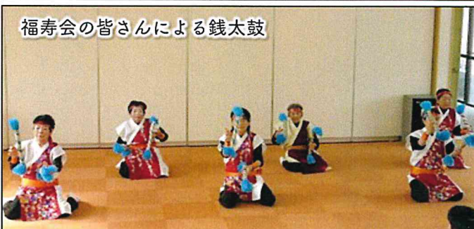
福寿会の皆さんによる銭太鼓