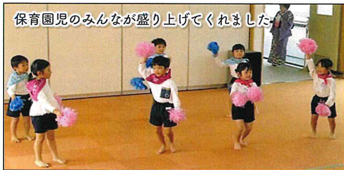
保育園児のみんなが盛り上げてくれました。