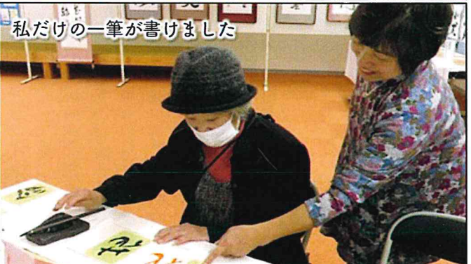
私だけの一筆が書けました