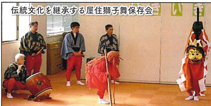
伝統文化を継承する屋住獅子舞保存会