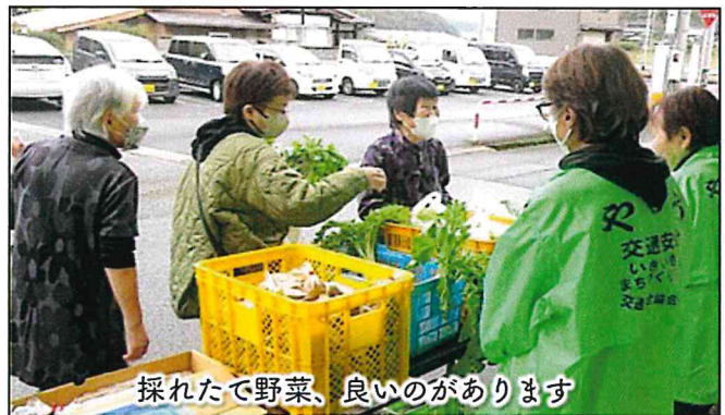
採れたて野菜、良いのがあります