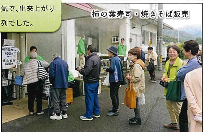
柿の葉寿司・焼きそば販売