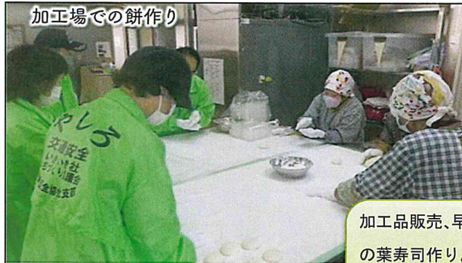
加工場での餅作り