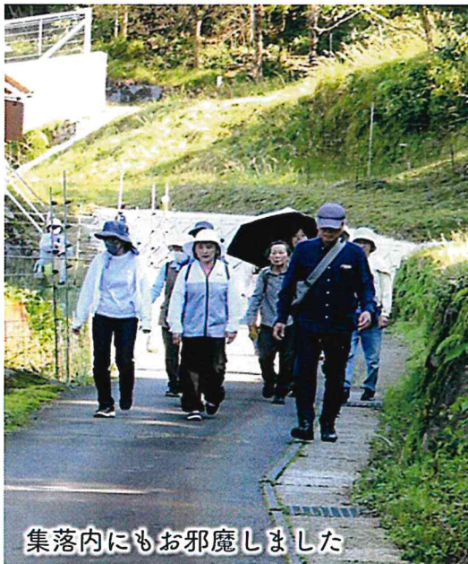
集落内にもお邪魔しました

年の瀬が迫り、今年も残り僅かとなってまいりました。今回は、秋に行われた事業での皆さまのご活躍を振り返ります。