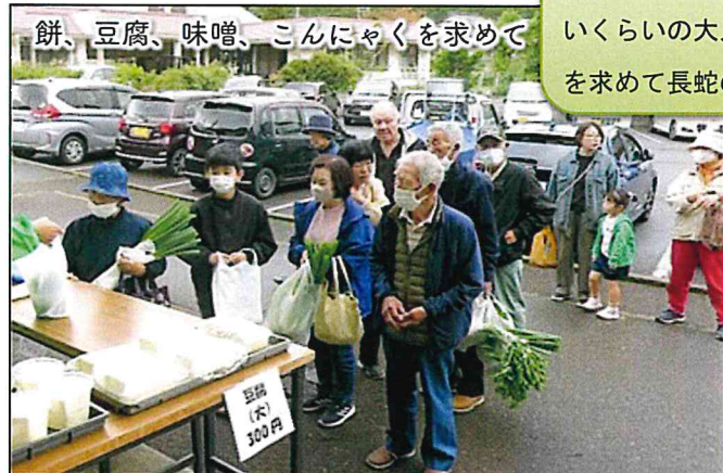
餅、豆腐、味噌、こんにゃくを求めて

加工品販売、早朝より餅作りに柿の葉寿司作り。製造が間に合わないくらいの大人気で、出来上がりを求めて長蛇の列でした。