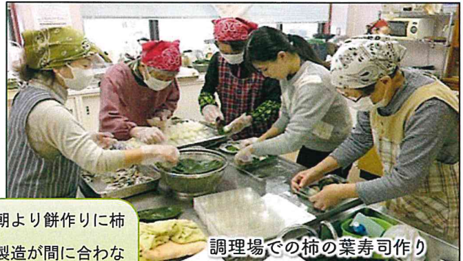
調理場での柿の葉寿司作り

加工品販売、早朝より餅作りに柿の葉寿司作り。製造が間に合わないくらいの大人気で、出来上がりを求めて長蛇の列でした。