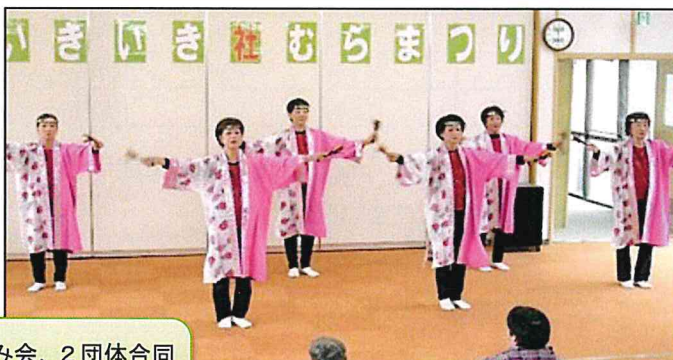
さくら会、むつみ会、2団体合同による銭太鼓、新舞踊を披露。