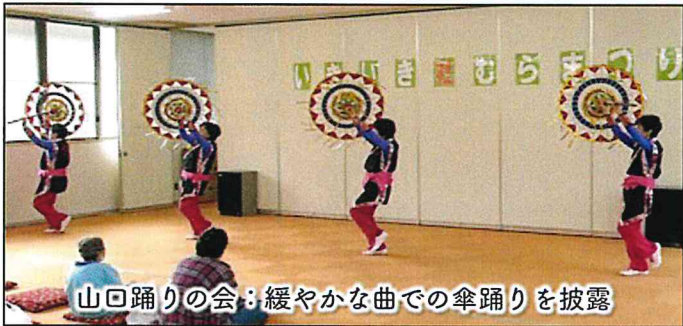
山口踊りの会：緩やかな曲での傘踊りを披露