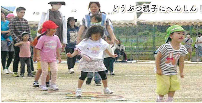
どうぶつ親子にへんしん!