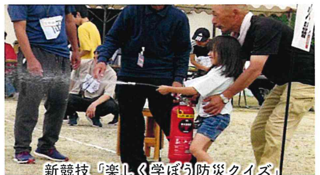
新競技「楽しく学ぼう防災クイズ」

文化・スポーツ部の事業として、10月には恒例の洗足山登山、健康ウォークを予定しておりますので、日程が近づきましたらご案内いたします。こちらも沢山のご参加をお待ちしています。