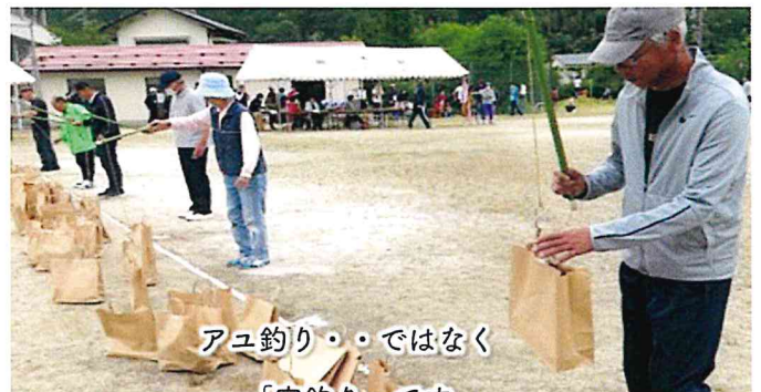
アユ釣り・・・ではなく