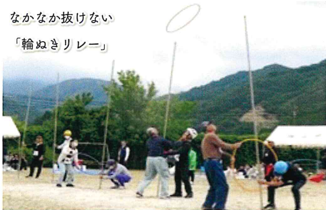
なかなか抜けない