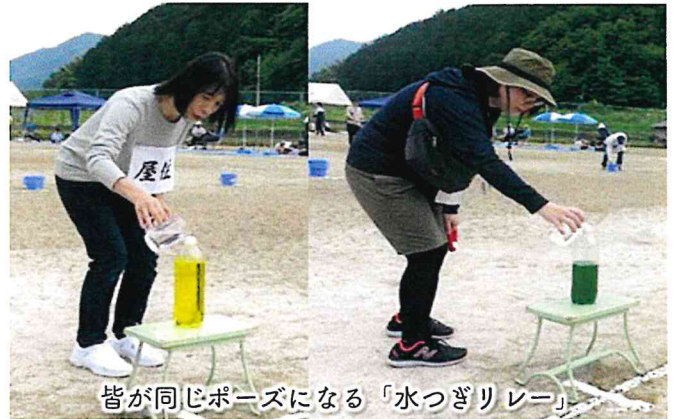
皆が同じポーズになる「水つぎリレー」