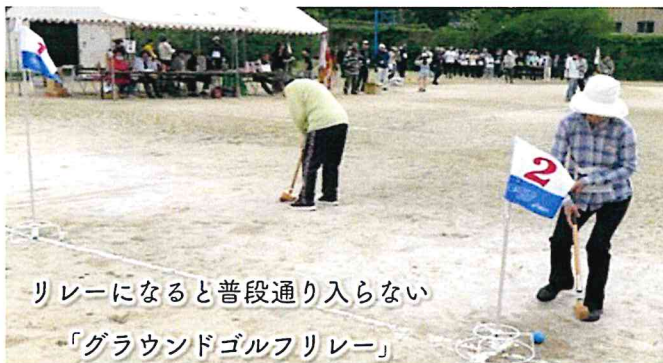
リレーになると普段通り入らない