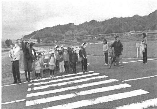
《長谷と倭文の登校班》

中学生は、21人です。倭文と倭文西の生徒以外は自転車通学となりました。自転車通学の生徒は小学生が歩いていると自転車を降りて歩きます。その理由を聞くと「歩行者がいるときは自転車を降りる」というルールがあるそうです。その他にも交差点では降りて横断歩道を歩いて渡るルールがあるようです。個人的には歩行者や車に気をつけて乗れば良いと思いますが、ルールをしっかりと守る姿勢に拍手を送りたいと思います。