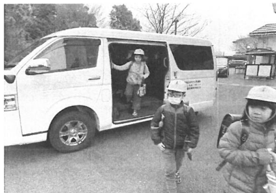
小学生の利用の様子

今後も少しずつではありますが、利便性を高めていき、地域の移動手段を確保していきたいと考えています。