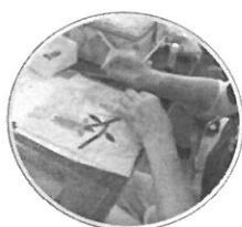
7月4日 地域の仲間づくり事業 パッチワーク教室