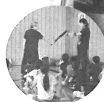
7月22日 子どもと大人のふれあい事業 スポーツチャンバラ