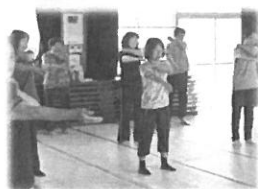
7月5日 特色ある公民館活動事業 気功体験教室