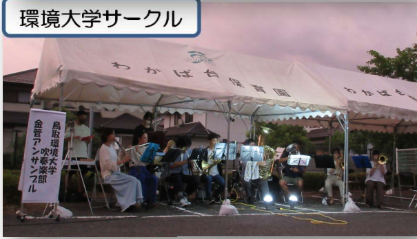
環境大学サークル