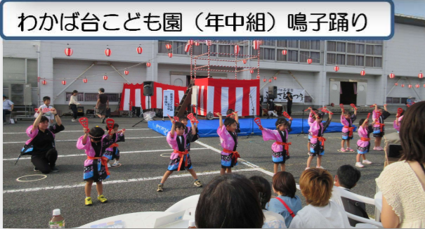
わかば台こども園(年中組) 鳴子踊り