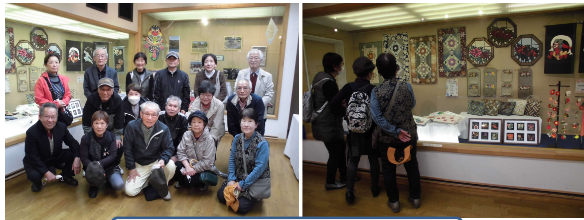
ガイドさんの話を聞きながらまち歩きをしました。