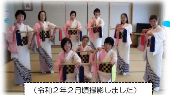
(令和2年2月頃撮影しました)

県スポーツレクリエーション、鳥取県との交流のある韓国等にも何度か出かけ親睦を深めてまいりました。他の公民館への指導にも出かけています。若葉台地区公館の女性教室から始め、はなみずき(民謡教室)として、敬老会、老人施設等に出かけています。全国で伝承されている聞き慣れた民謡です。時には生演奏とのコラボもあります。脳の活性化にもつながります。どうぞおこしく下さい。お待ちしております。