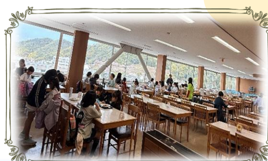
うどんやカレーを食べたよ

桜の花が満開を迎えた4月7日(火)、鳥取県立博物館で開催中の「コナン展」に行ってきました。絵コンテやアフレコ風景の見学、スペシャルムービー視聴などを楽しみました。その後は県庁食堂で昼食をとり、わらべ館やきなんせ広場にも立ち寄りしました。最後はみんなで路線バスに乗って帰途につき、大冒険の楽しい一日となりました♪～ (参加人数：39名)