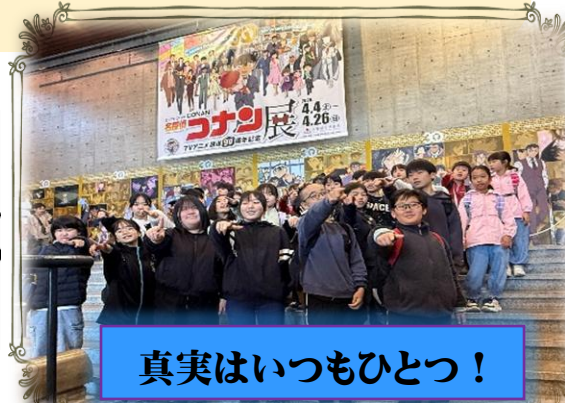
真実はいつもひとつ！