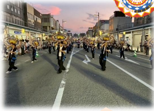
令和7年度若桜街道にて