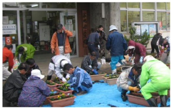
6月・11月プランター花苗植栽（全自治会）