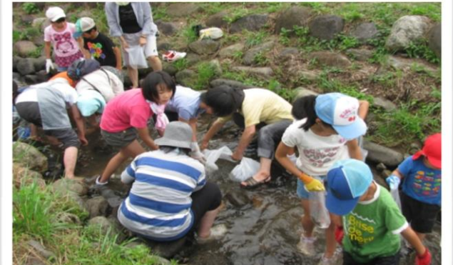
素早い動きのにじますに悪戦苦闘の子ども達