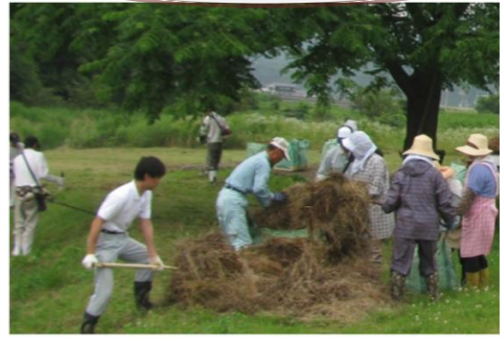
6,8,10月地域住民の皆さんのご協力に感謝！