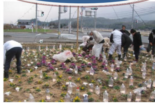
廃油で作ったロウソクにカバーをかぶせ、点灯