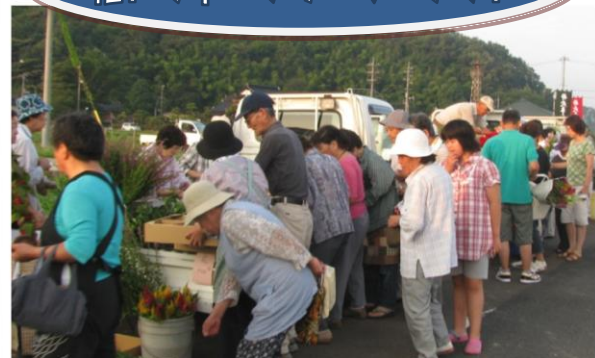
8月は早朝に、10月は公民館まつりで開催