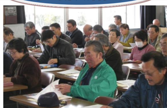
地域ふれあいの集いで講演を聞き、防災意識を高めました