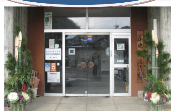
公民館前に見事な対の門松を設置して頂きました