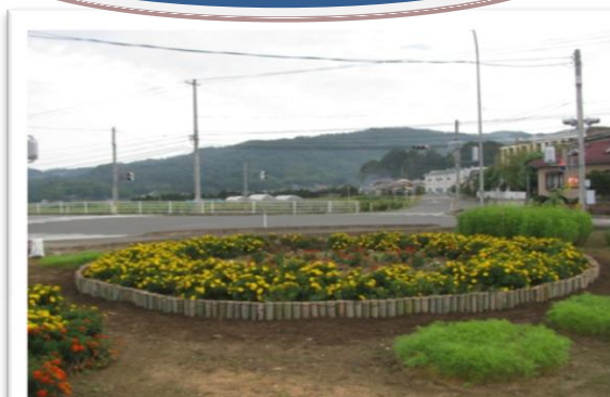
日頃の整備と共に、土入れ整備できれいな花壇に