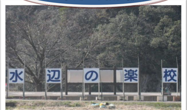
看板設置作業完了。皆さん大いにご利用下さい