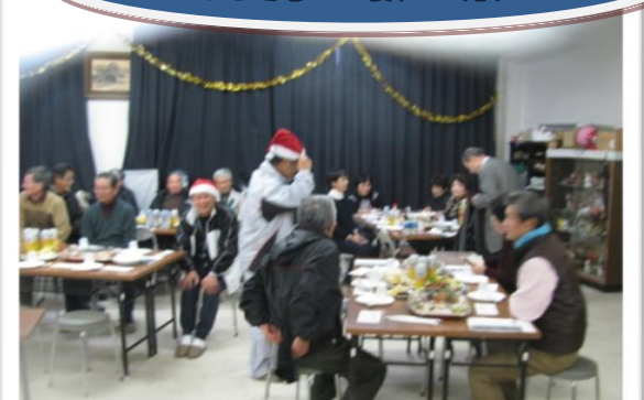
歌のゲストを招き、皆で楽しいひと時を過ごしました