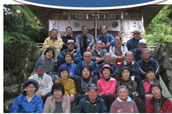
糸谷神社、高岡神社を巡り、約4.8kmの史跡散策