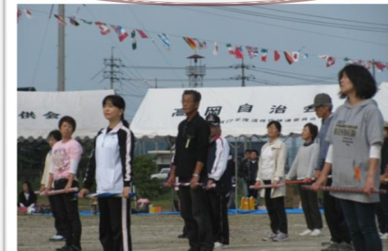
健康維持を目指し毎年、取り組んでいます