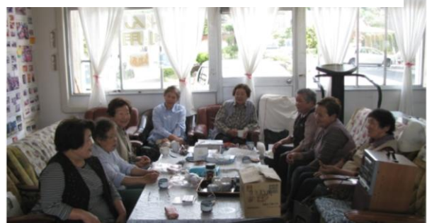
利用者も増えてきました。お気軽にご利用下さい