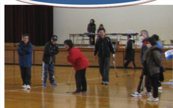
運動不足解消と、地域の皆さんの交流の場となりました