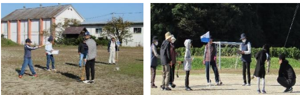
初挑戦の子ども達、とても上手でした!