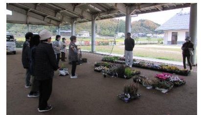
色鮮やかな寄せ植えが出来ました