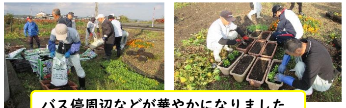
バス停周辺などが華やかになりました