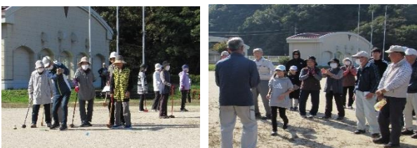
交流深まる秋のひとときを過ごしました