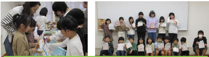
自由に飾りつけて、個性あふれる作品が完成☆