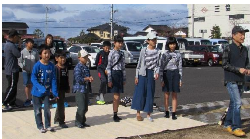
軽トラ市、スリッパ飛ばし、ホールインワンなど多数のイベントで賑わいました