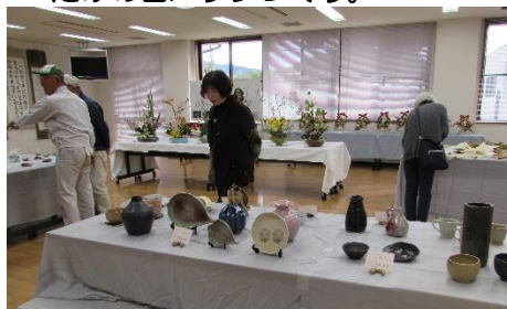
さつき保育園、国府東小学校の子ども達やグループ、サークル、個人参加の皆さんによる、力作揃いの作品。