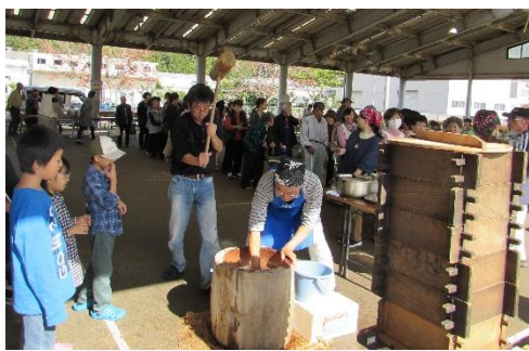
大人気! つきたての杵つき餅に長蛇の列