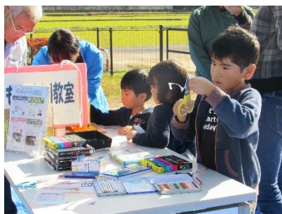
指導をうけながら世界にひとつだけの缶バッチづくり。