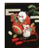
A B C(巾20cm 高さ24cm)