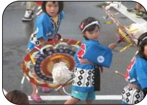
川 川 掛け声も元気に傘踊り 園児によるオープニング

8月1日(土)大正地区公民館駐車場でほっとヨイ！ヨイ！夏まつりを開催し、約700人の人出でにぎわいました。