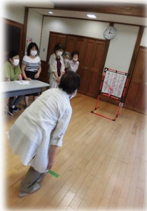
ゲームを楽しみました