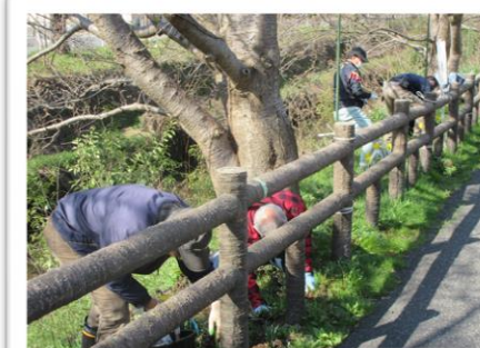
スイセンのまわりの土入れと草とり