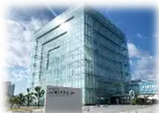
人と防災未来センター