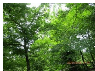
北野天満宮史跡御土居の青もみじ苑