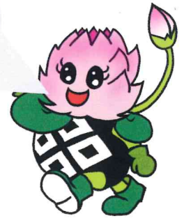
マスコットキャラクター ハッスルン

蓮ウォーク参加者全員に ホットピア鹿野入浴券を プレゼント！ お楽しみ抽選会も あります！