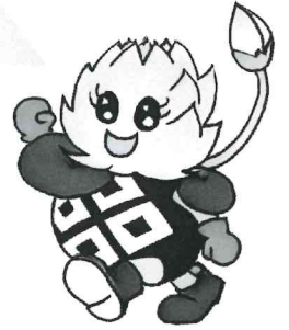
マスコットキャラクター ハッサルン