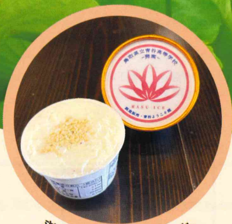
蓮の加工品を楽しむ