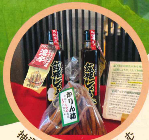
抽選会で特産品を楽しむ