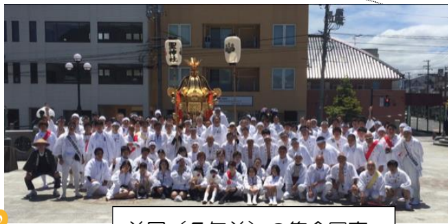
前回（5年前）の集合写真