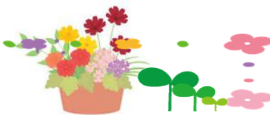
花苗の販売もあります。