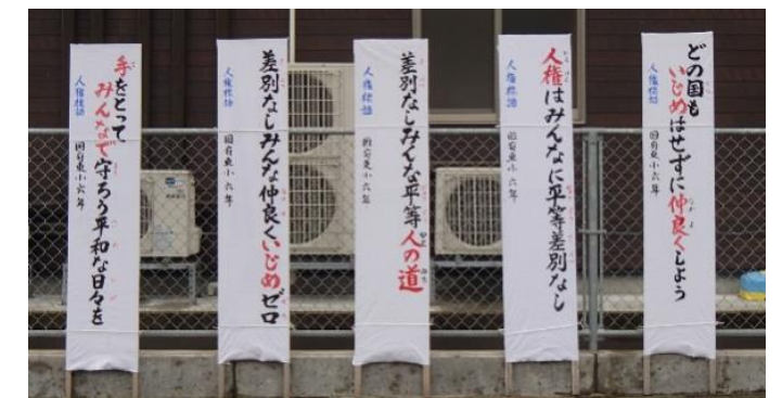
国府東小学校の成器地区6年生(5名)の作品です。皆さん、是非ご覧下さい。