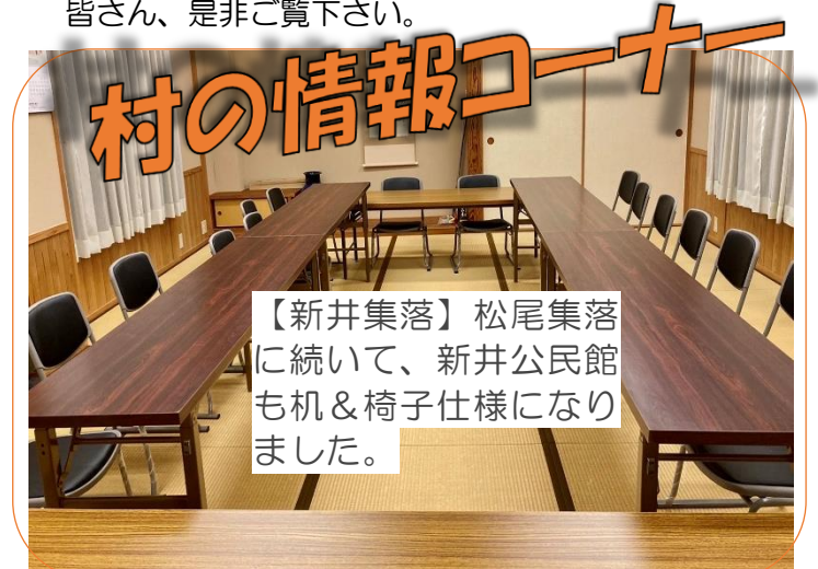
【新井集落】松尾集落に続いて、新井公民館も机&椅子仕様になりました。