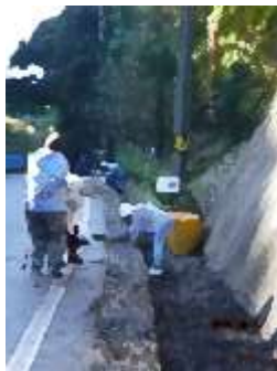
昨年秋、樽谷坂環境整備