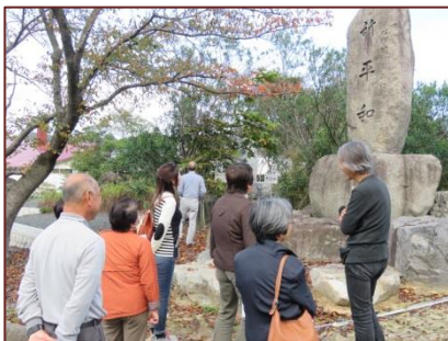
西人権福祉センターにて研修