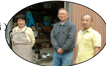
こちらの方をはじめ、多くの方のご意見をいただきました。

特色ある食べ物 ・加瀬木大根、ごぼう...かたくずれがしない、香りがよい ・たけのこ...糠で下ゆでしなくてもえぐくない ・畑の土質がよいので、野菜が無肥料で育つ。