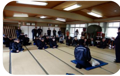
5つの分団が集結 地区民あわせて総勢40名

3月19日、逢坂地区公民館を会場に、気高地区消防団による救急救命講習会が開催されました。 講習会には、分団員以外に、地区内から14名が参加し、心肺蘇生法やAEDの使用法などの講習を受けました。