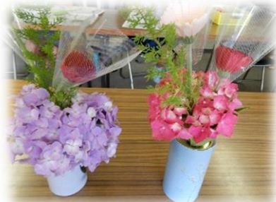
お花の扱い方が難しい様でしたが1年生もがんばって生けました