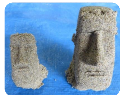
オーブンで焼いて完成！