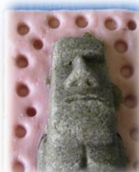
型枠に砂をつめて…。

大きい物でオーブントースターで5~8分焼いて完成！！乾燥したら、色を塗って仕上げていました。