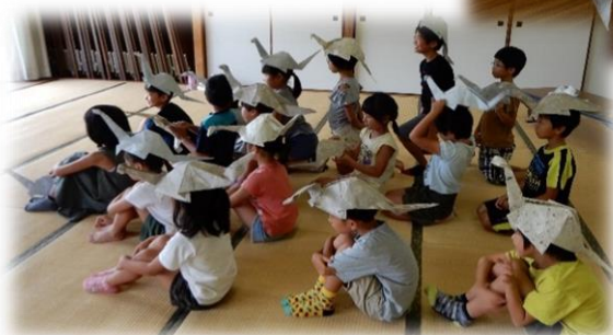
作成した恐竜を頭にかぶって写真撮影！