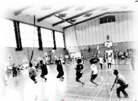
今年初の ジャンボ縄跳び