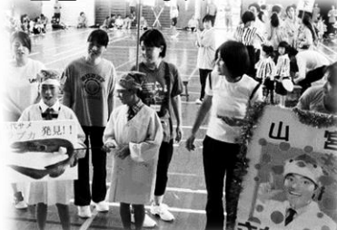
睦逢 魔女の宅急便