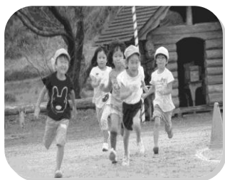
未来を担う保育園児の力走！