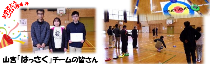
山宮「はっさく」チームの皆さん