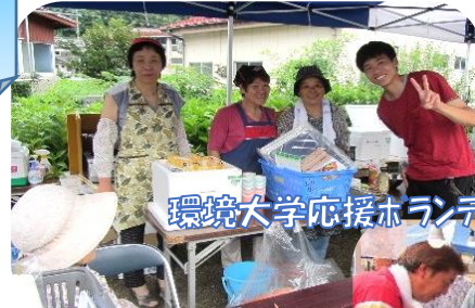
環境大学応援ボランティアのみなさんと

来場者 130 人。今年も盛大に開催！心配した雨にもあわず、バザーの美味しい品々は完売しました。猛暑続きの夕べを栃本農村公園で弦楽器の演奏やゴスペルの歌声、力強い傘踊りを観ながら涼み七夏の夕べを楽しみました。