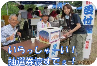
いらっしゃい！ 抽選券渡すでえ！