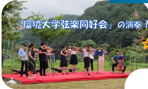
「環境大学弦楽同好会」の演奏！