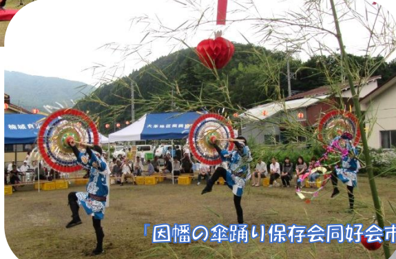
「因幡の傘踊り保存会同好会市役所支部」の力強い踊りと唄声！