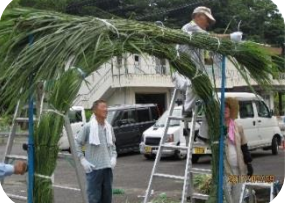
今年も立派な「茅の輪」出来上がりました！