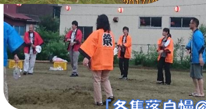
「各集落自慢の踊り」皆で輪になって！