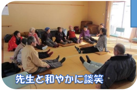
先生と和やかに談笑