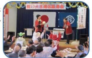
寸劇「健康ジョブながいき」