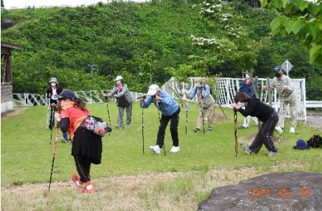
【スタート前の準備体操も念入りに】

7回目の今回は過去最多の参加者22名と全日本ノルディックウォーク連盟から2名のインストラクター、ぴょんぴょんネットの取材も同行され、楠城 BBQ ハウスをスタート。天気もよく爽やかな風に吹かれながら雄大な景色を満喫し、健脚の皆さんは約6kmのウォーキングを楽しみました。