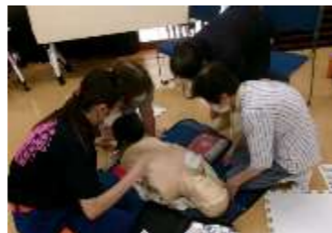
鳥取市消防団女性分団のAEDの使い方と心臓マッサージの方法を学びました。