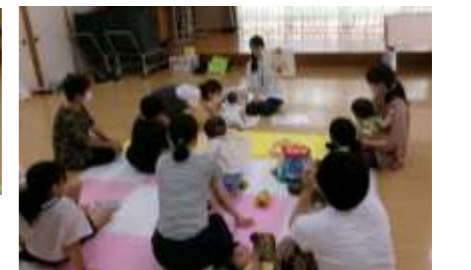
歯科衛生士さんに歯のことを教わり、保育士さんには楽しく遊んでいただきました♪ プール遊びも楽しかったね!