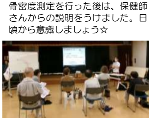
骨密度測定を行った後は、保健師さんからの説明を受けました。日頃から意識しましょう☆