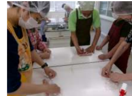
つくしんぼさんにソーセージの作り方を教わりました。色々な種類のソーセージを作り大満足でした♪