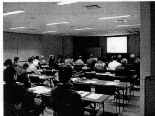
設立総会の会場風景