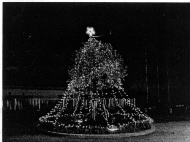
公民館前庭で美しく輝くイルミネーション