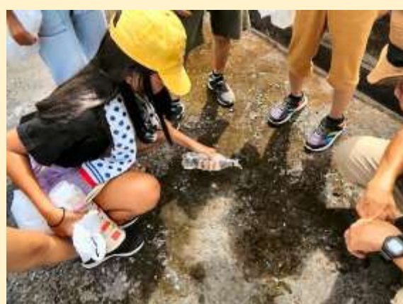
乾いたコケに水をあげるとあら不思議…変化を楽しみました