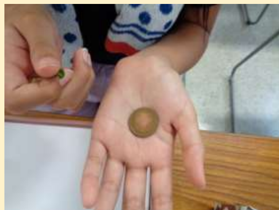
10円玉をピカピカに磨ける葉（かたばみ）を見つけたよ!!