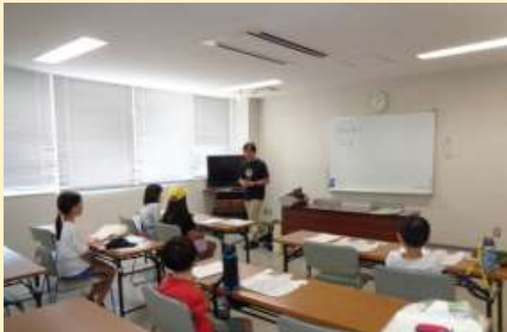
湖山西地区『らんまん』体験ツアー座学