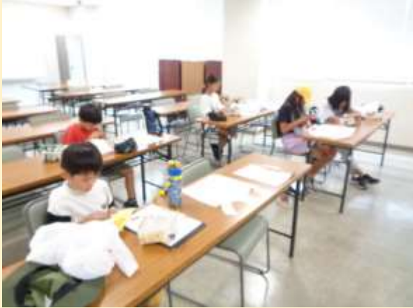
座学の様子とその内容