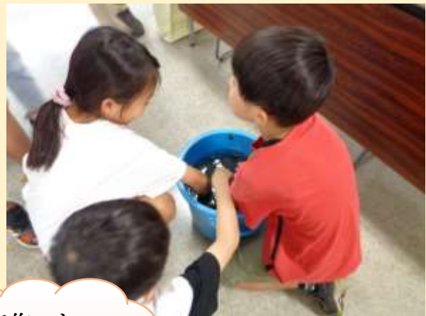
タブの葉で作った 化粧水の感触を 体験中！