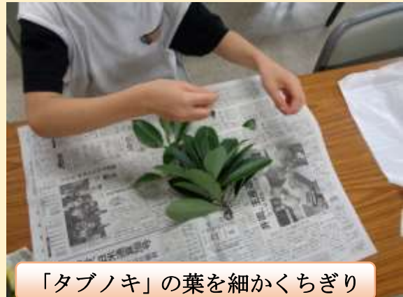
「タブノキ」の葉を細かくちぎり