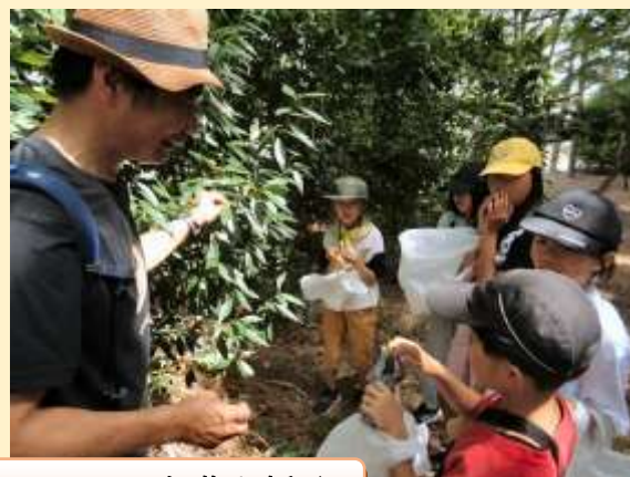
公民館周辺に出かけていろいろな葉を採取