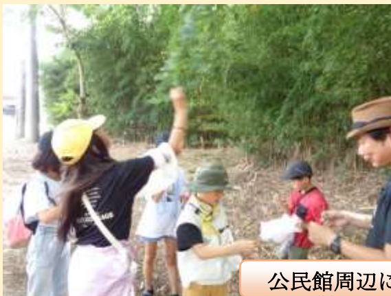
公民館周辺に出かけて葉を採取