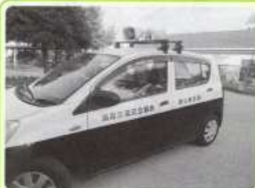
夏休み 夕方パトロール

青少年育成湖山西地区委員会会員の皆様、各種団体役員の皆様、ご協力ありがとうございました。