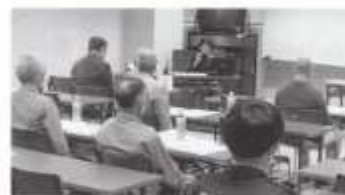
話に関き入る参加者