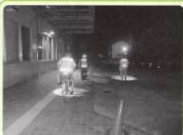
夏休み 夜間パトロール

8月3日～8月24日(月・木曜日) 18時～18時40分 計9回実施(延べ16名) 巡回場所 公民館・特別支援学校・堀越公園・学園前団地公園・旧R9 ↓南5丁目踏切・鳥大南団地公園・鳥取大学駅前・鳥西交差点・湖東中学校・湖山公園・北四公園・白浜飛行場公園・大寺屋1号公園・西小公民館 記録 今年は「コロナ感染予防のため、パトロール車での定員を2名として回数を増やしました。町内全域を巡回中、公園で、児童や親子を見かけたので、早く帰るようにながしました。 協力 自治会・社協 交安協・老く連 西小PTA 民児協・子ども会