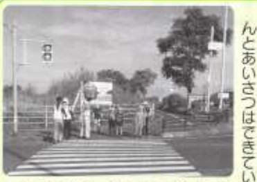
夏休み あいさつ運動

8月4日～8月21日(火・金曜日) 20時～21時 計5回実施(延べ47名) 巡回場所 公民館・若草学園・大寺屋2号公園・鳥大前駅・湖山公園 ↓大寺屋1号公園・西小公民館 記録 公園や駅周辺を徒歩で巡回。無灯火で走行する自転車があり、警察のかたより指導していただいた。その他は、特に異常ありませんでした。 協力 自治会・湖山西小・湖東中・社会福祉協議会 民生児童委員協議会・保護司会・交通安全協会 健康づくり推進員協議会・老人クラブ連合会 子ども会指導者連絡協議会・食育推進委員会・体育会 湖山交番