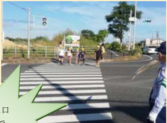
空港西入口 交差点で あいさつ運動 9月2日