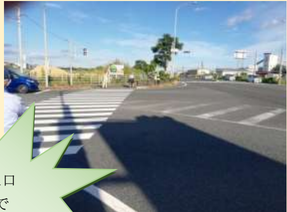
空港西入口 交差点で あいさつ運動 9月2日