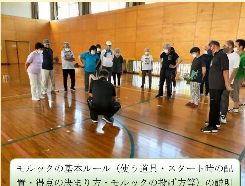
モルックの基本ルール（使う道具・スタート時の配置・得点の決まり方・モルックの投げ方等）の説明