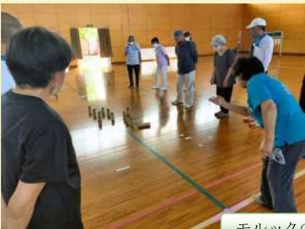
モルックの初投擲!!