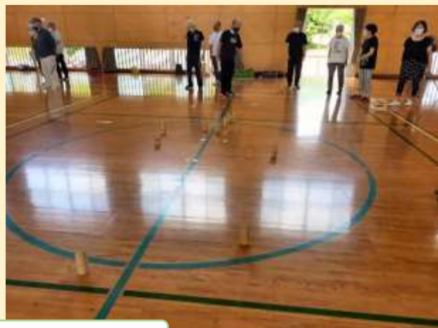
モルック競技にみんなで挑戦!!