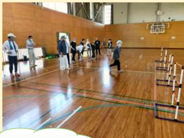
最後に、既に体験済みのラダーゲッター競技で腕を競い合う!!