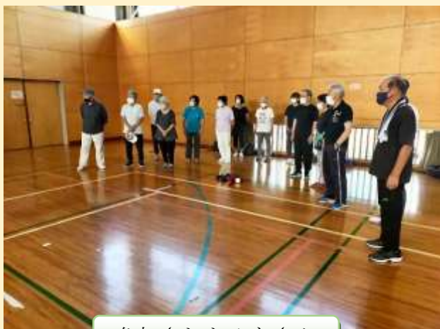
参加されたみなさん