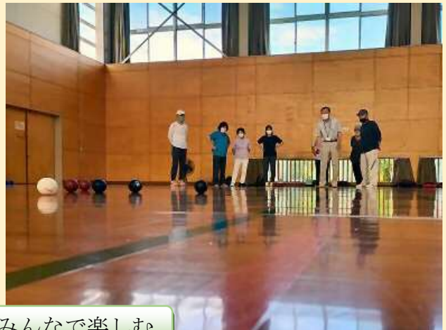
ボッチャ競技をみんなで楽しむ