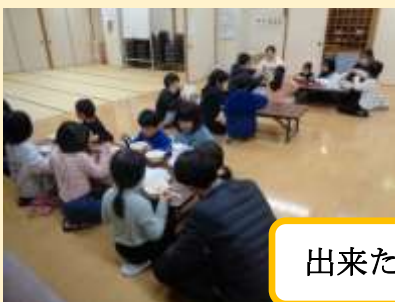
出来たてのお餅を皆でいただきました、美味しかったね!