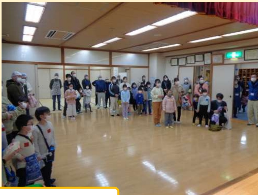
餅つきを楽しむ集いの開始式