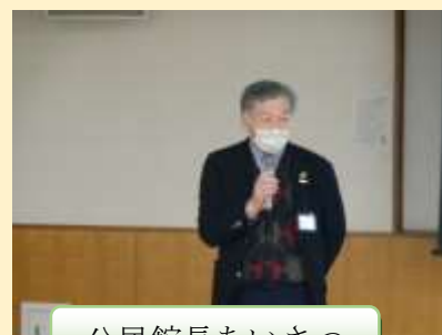
公民館長あいさつ