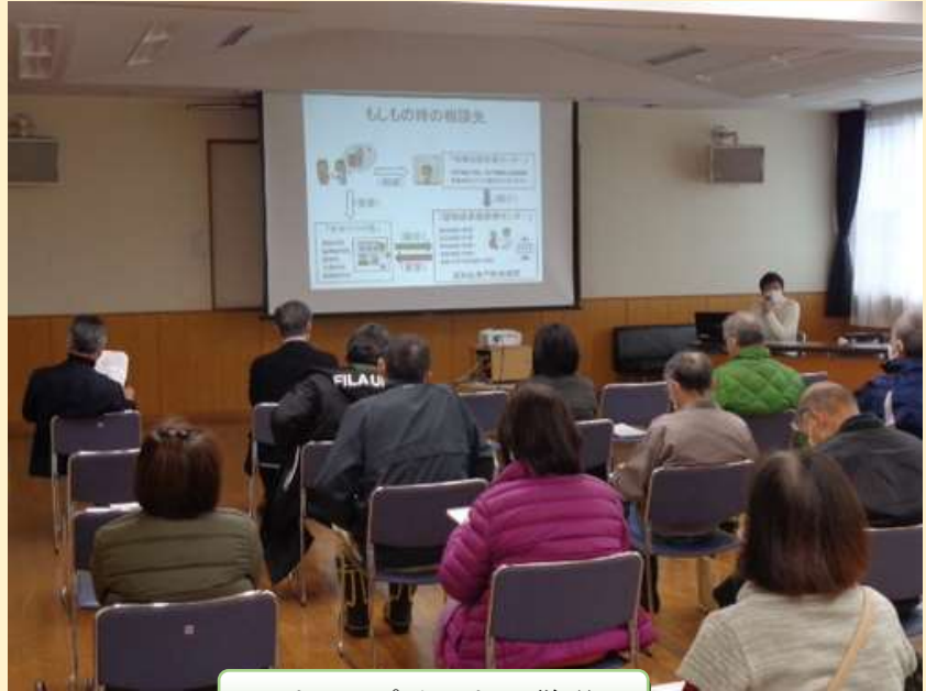
パワーポイントで説明