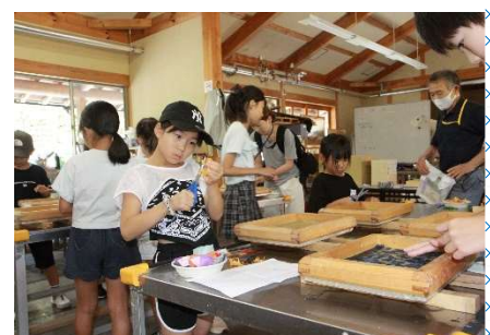
真剣な眼差しで何かを切っている