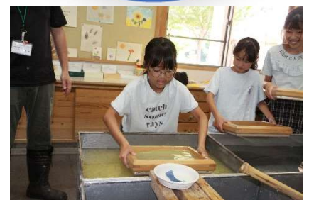
恐る恐るの手つきでチャレンジ

【感想】・昔の人の生活は、以外と難しかったです。6年生で歴史を習う時に役に立つと思います。(4年生)・2000年前からそんな人たちがいてビックリしました。(4年生)・鳥取の因州和紙は普通の和紙との違うことがわかりました。(5年生)・紙すきが上手にできて楽しかった。昔の生活じゃいやだ。(1年生)