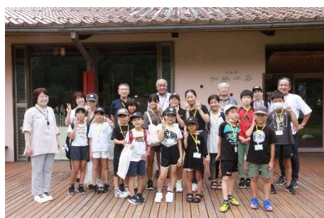
和紙工房前で記念撮影