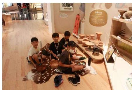
弥生人になって楽しんでいます