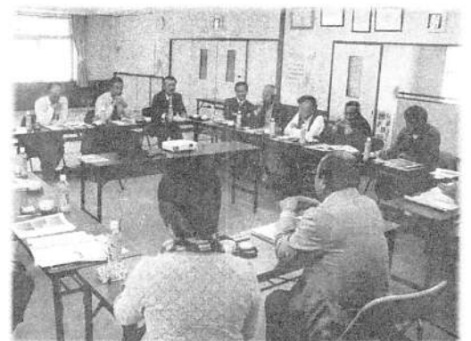
西脇市日野地区区長会の皆さんと意見交換