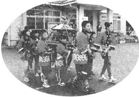
元気いっぱい 子どもみこし

第19回中ノ郷まつりを10月26日(土)~27日(日) 地区公民館・中ノ郷小学校・同体育館で開催しました。